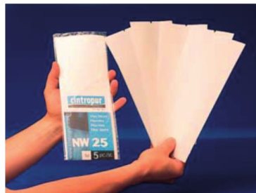
Filterstrumpor i reningsgraderna 5, 10, 25, 50 och 100 mikron.