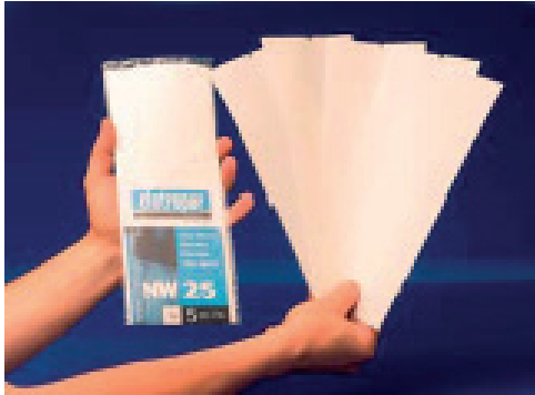
Filterstrumpor i reningsgraderna 1, 5, 10, 25, 50, 100, 150 och 300 mikron