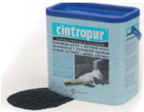
Aktivt kol för påfyllnad.