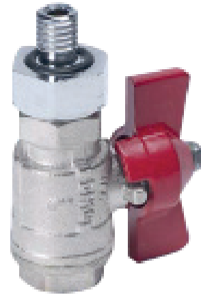
Dränventil för tömning av partiklar i filterhuset.