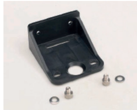
Väggfäste förenklar installationen och avlastar rören.